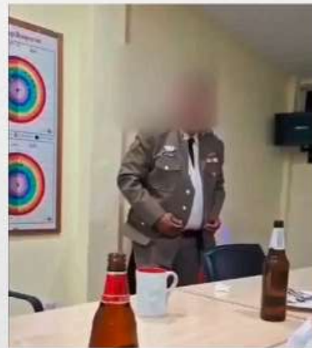
กรณีตัวอย่าง โดนสั่งขัง 3 วัน และโดยตั้งคณะกรรมการสอบวินัยร้ายแรง

การสวมใส่เครื่องแบบข้าราชการไปดื่มสุราหรือเครื่องดื่มแอลกอฮอล์ ถือเป็นพฤติกรรมที่ไม่เหมาะสมและมีความผิดทางวินัยอย่างร้ายแรง เนื่องจากเป็นการทำลายภาพลักษณ์ ศักดิ์ศรี และความน่าเชื่อถือของความเป็นเจ้าหน้าที่รัฐในสายตาประชาชนอย่างมาก